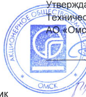
График к договору 08р/2-54 от 14.11.2018 на 2021 год выполнения работ АО «Омскгоргаз» по ТО ВДГО/ВКГО тип ВКГО: Плита бытовая