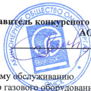
График проведения работ по техническому обслуживанию внутридомового и внутриквартирного газового оборудования на 2024 г. ТСЖ "Надежда"