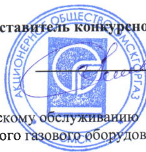
График проведения работ по техническому обслуживанию внутридомового и внутриквартирного газового оборудования на 2024 г. ООО УК "Вежливая"