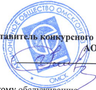
График проведения работ по техническому обслуживанию внутридомового и внутриквартирного газового оборудования на 2024 г. (дополнительный) ООО УК Омскстройполимер