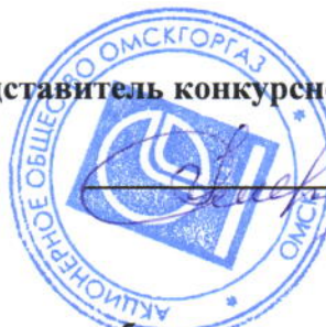
График проведения работ по техническому обслуживанию внутридомового и внутриквартирного газового оборудования на 2024 г. ООО "УК МИР-1"