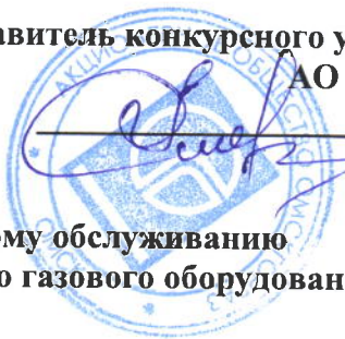
График проведения работ по техническому обслуживанию внутридомового и внутриквартирного газового оборудования на 2024 г УК Жилищник - 3