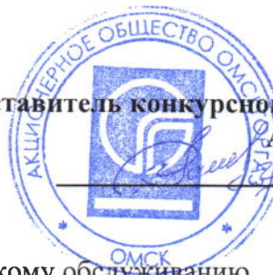
График проведения работ по техническому обслуживанию внутридомового и внутриквартирного газового оборудования на 2025 г. ТСЖ "Содружество"