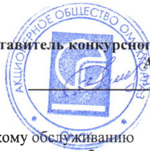
График проведения работ по техническому обслуживанию внутридомового и внутриквартирного газового оборудования на 2025 г.