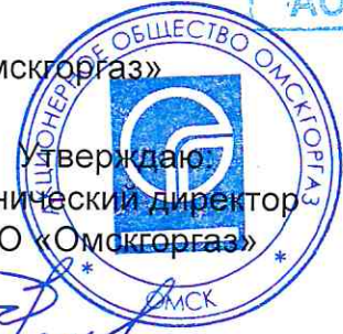
График ГГО-5 к договору 08р/2-286 от 27.12.2023 на 2025 год

выполнения работ АО «Омскгоргаз» по ТО ВДГО/ВКГО тип ВКГО: Плита бытовая