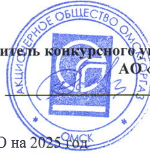
График ТО ВДГО/ ВКГО на 2025 год ТСЖ "Коммунальник "

Утверждаю Представитель конкурсного управляющего АО «Омскгоргаз» Э.В. Рамзаев