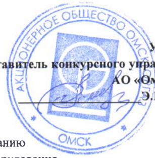
График проведения работ по техническому обслуживанию внутридомового и внутриквартирного газового оборудования на 2025 г. Иртышские зори-2 ТСЖ