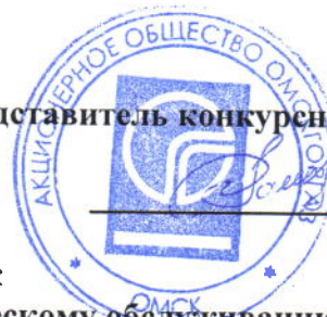
График проведения работ по техническому обслуживанию внутридомового и внутриквартирного газового оборудования на 2025 г ООО "УК Жилищник 4-сервис"