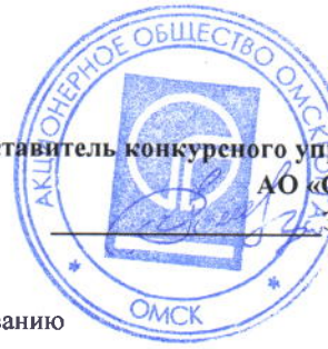
График проведения работ по техническому обслуживанию внутридомового и внутриквартирного газового оборудования на 2025 г. ООО УК "Доверие"